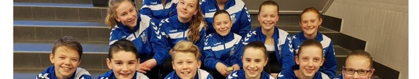
meer foto's staan op onze facebookpagina https://www.facebook.com/DOK1922/