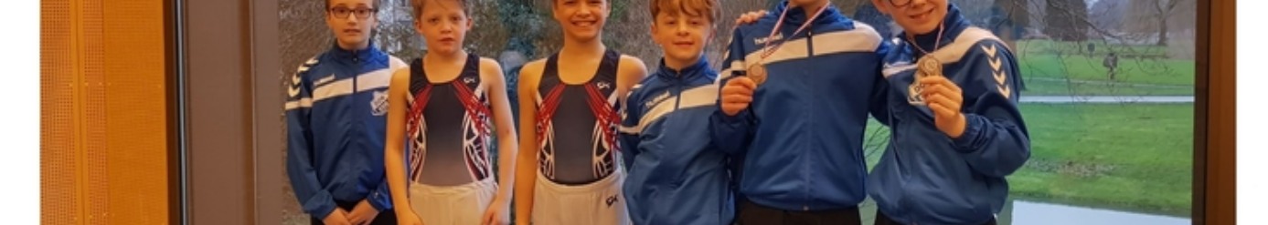
meer foto's van deze wedstrijd staan op onze facebookpagina https://www.facebook.com/DOK1922